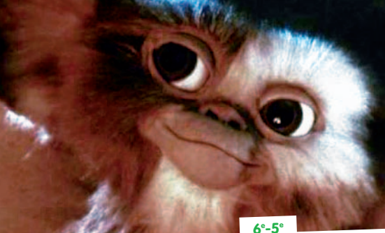
GREMLINS DE JOE DANTE +