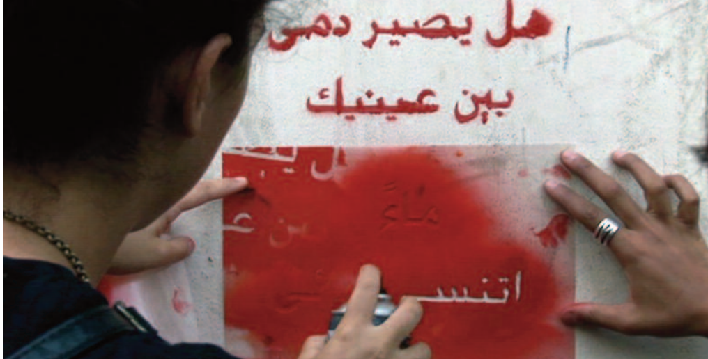
LE PRINTEMPS D'HANA