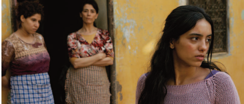
LE SAC DE FARINE