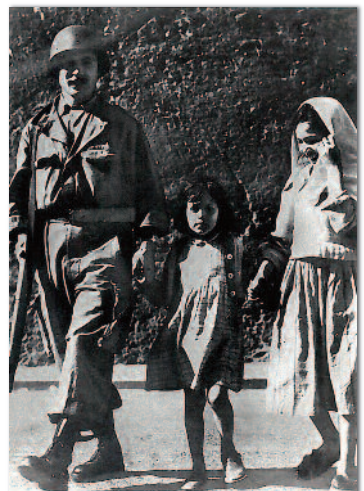
COMBIEN JE VOUS AIME