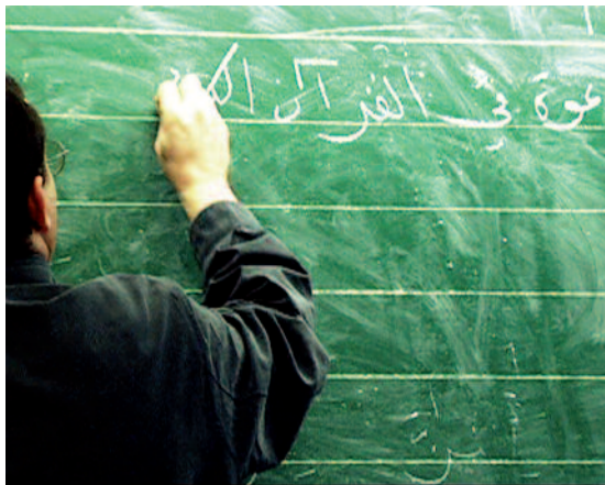
LES IMAMS VONT À L'ÉCOLE