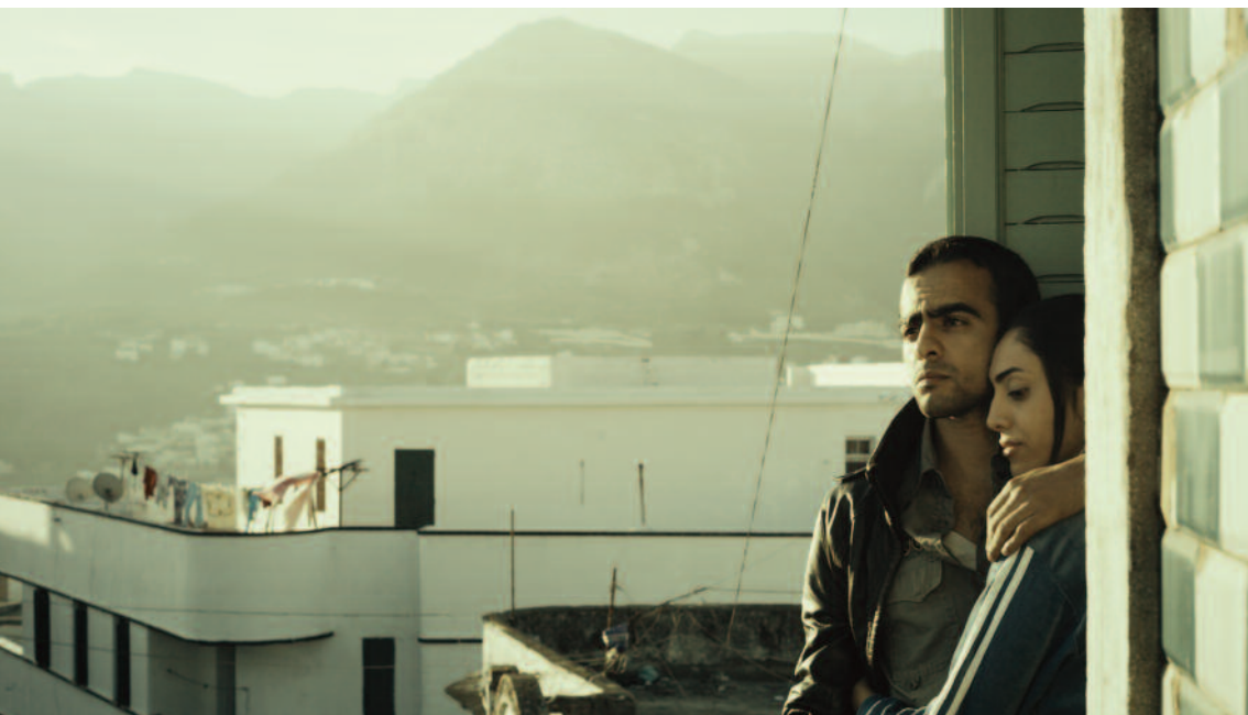
DEATH FOR SALE

1 ALLÉE DU PROGRÈS 93120 LA COURNEUVE 01 48 35 23 04