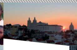
Lisboa orchestra de Guillaume Delaperrière