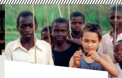
Kwa Heri Mandima de Robert-Jan Lacombe