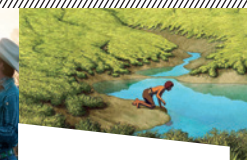
La Tortue Rouge de Michael Dudok de Wit