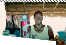
Madagascar de Bastien Dubois