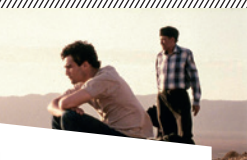
Le Grand Voyage d'Ismaël Ferroukhi