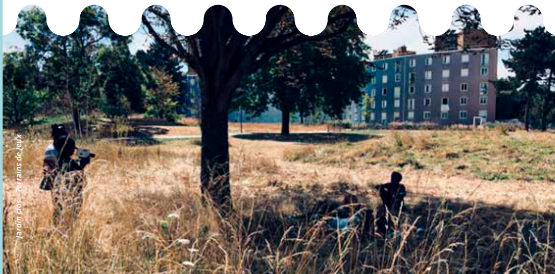
la rûin pios - Terrains de Jeux