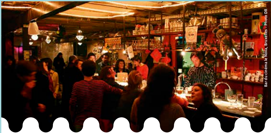
Bar du cinéma le Nova, Bruxelles