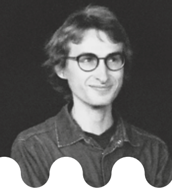
Jacopo Rasmi

Séance précédée de la projection du court métrage Palma d'Alexe Poukine (France, 2020, 40min) Jeanne emmène sa fille de six ans en week-end à Majorque. Alors que tout part à vau-l'eau, la seule préoccupation de la mère est de photographier Kiki, la mascotte de la classe.