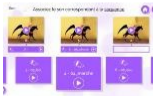
L'ATELIER CINÉMA CNC