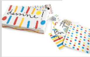
DESSINE ! Hervé Tullet