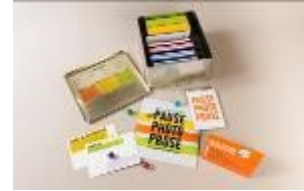
PAUSE-PHOTO-PROSE Rencontres photographiques d'Arles

Le transport du matériel est à la charge de l'emprunteur