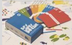
LES MOTS DU CLIC Simultania