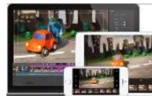
STOP MOTION STUDIO Apple