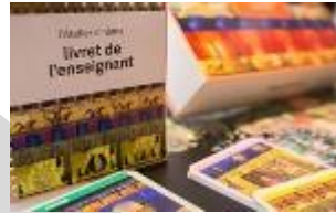
L'ATELIER CINÉMA CNC