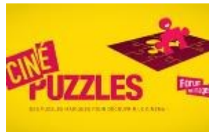
CINÉ PUZZLES Forum des Images