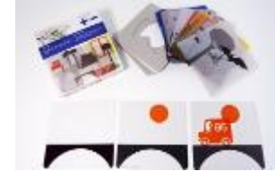
PLUS AND MINUS Bruno Munari