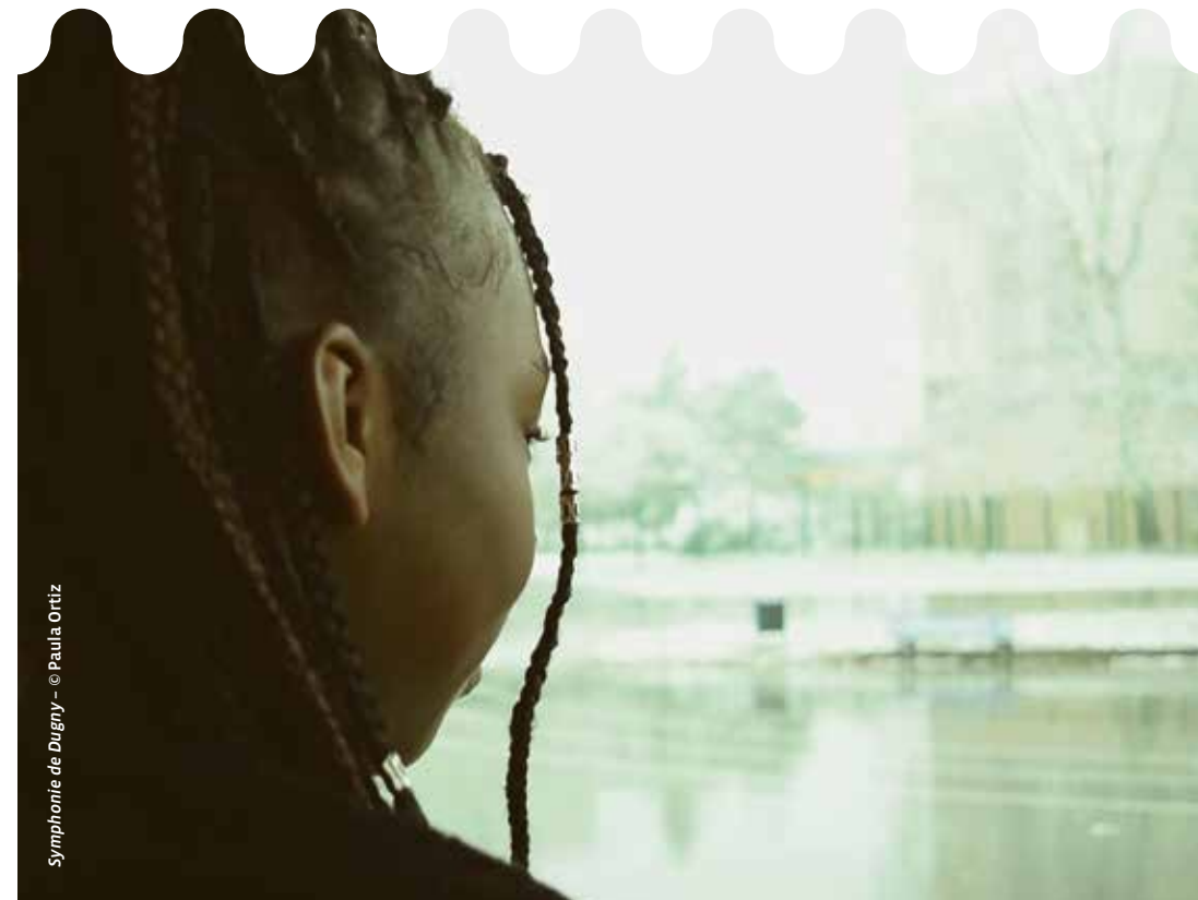
Symphonie de Dugny - © Paula Ortiz

2• Le dispositif La Culture et l'Art au Collège s'adresse aux collèges publics de la Seine-Saint-Denis et a pour singularité de placer au cœur des projets la relation aux artistes et aux scientifiques. Un appel à projets annuel en direction de toutes les structures culturelles et scientifiques permet aux artistes et aux scientifiques de co-élaborer avec les collègues des parcours d'une quarantaine d'heures.