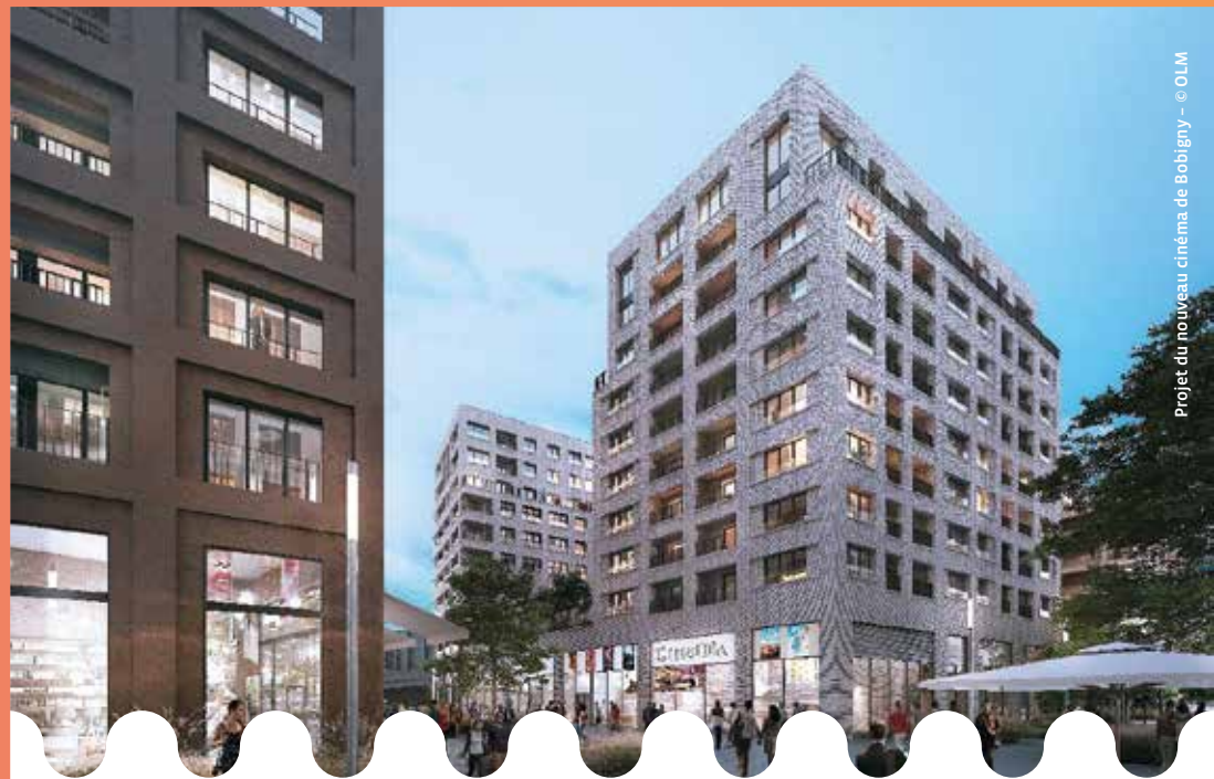
Projet du nouveau cinéma de Bobigny - © OLM