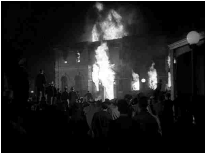
F. Lang Fury 1936