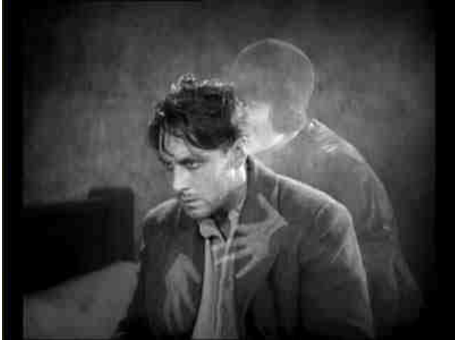
W F Murnau Sunrise 1926