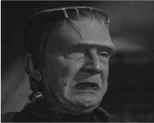
Bela Lugosi en « Créature »