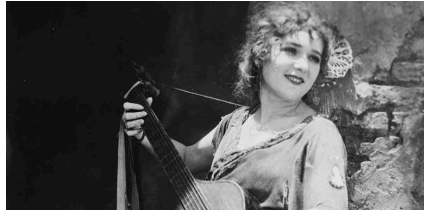
E. Lubitsch Rosita 1923