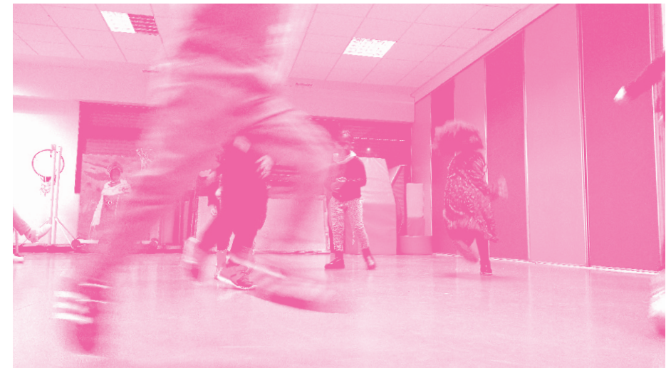
© Cinémas 93 / atelier Danser son film dans le cadre de Ma Première Séance